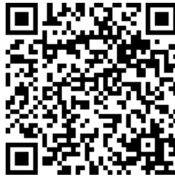
ジオツアー (11 月 2 日)

問い合わせ：京都大学防災研究所・徳島地すべり観測所 (0883-72-1075)